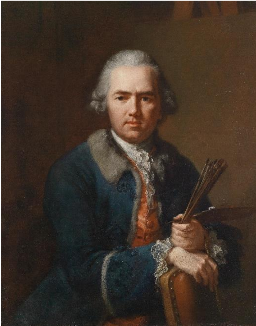
J.H. Tischbein d. Ä., Selbstbildnis, 1770

Aus Anlass des 300. Geburtstages von Johann Heinrich Tischbein d. Ä. in diesem Jahr gibt es zahlreiche Ausstellungen und Vorträge. Aus dem Kloster Haina stammend und als Sohn eines Bäckers geboren, machte Tischbein in Kassel eine große Karriere: er war damit einer der erfolgreichsten Maler der Tischbein-Familie und erreichte als Hofmaler und Akademiedirektor eine angesehene Stellung. Wichtige Schritte zum Erfolg waren seine Reisen nach Frankreich und Italien, von denen er zahlreiche Anregungen mit brachte. Wie sahen diese aus und wie setzte Tischbein diese um? Was war das Neue an seiner Kunst und was war es, das gefiel? Diesen Fragen geht der Vortrag nach.